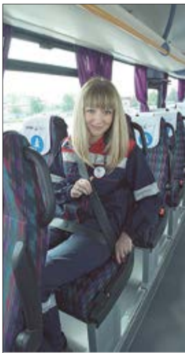
Для того чтобы исключить риск травматизма, достаточно соблюдать простое правило – застегнуть ремень безопасности

Соблюдение норм и правил в области охраны труда, промышленной, пожарной и экологической безопасности является обязательным для каждого работника «Славнефть-Мегионнефтегаза», его дочерних обществ и подрядных организаций. Посещая то или иное месторождение, мы не раз убеждались в том, что при выполнении любой промышленной операции вопросы HSE всегда ставятся во главу угла. Но это на производстве. А как обстоят дела в городе? Там, где на первый взгляд нет опасных производственных объектов и инженера по охране труда. Придерживаются ли офисные работники правил безопасности? К примеру, по пути на работу.