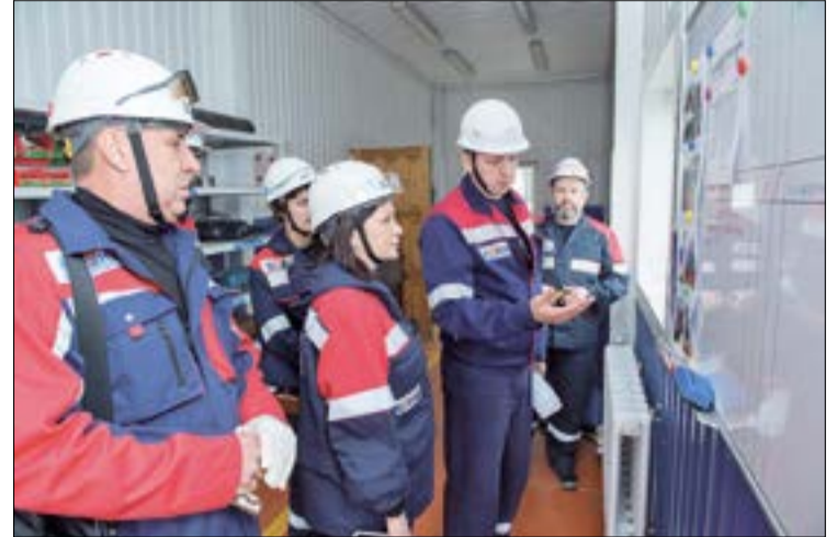
В процессе линейного обхода лидеры функций могут оценить эффективность применения инструментов бережливого производства на практике

Линейный обход – это работа на перспективу. Темы, вынесенные на обсуждение, нюансы, на которые обратили внимание участники, приняты в работу. Учитывается и тот факт, что текущий этап внедрения концепции бережливого производства – это, по сути, начало пути для коллектива «Мегионнефтегаза» и достигнутые результаты – это только