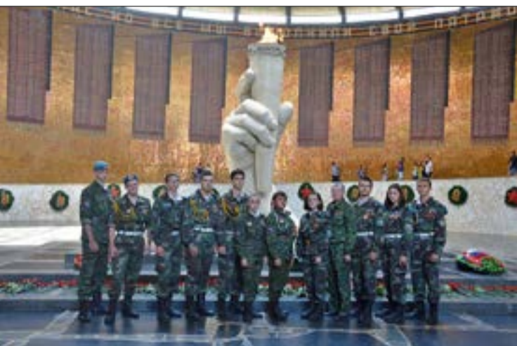
Для этих ребят уважение и гордость за историю своей страны не просто слова, это смысл и стержень их жизни

Многие поисковики удостоены наград различной степени, в том числе медалей «За активный поиск». 9 мая 2016 года представители отряда «Истоки» принимали участие в Параде на Красной площади в Москве.