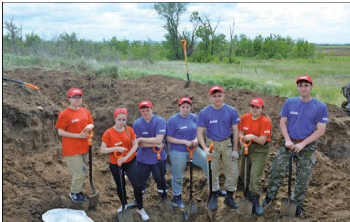
В ходе поисковой экспедиции в Волгоградской области ребятами из мегионского отряда «Истоки» (в составе сводного отряда Югры) были найдены останки 74 защитников Отечества

примечательность», а дань памяти людям, благодаря труду которых вырос Мегион.