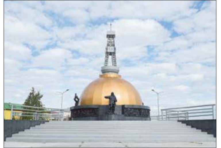
После реставрационных работ купол памятника Первопроходцам вновь сияет золотом. И в наших силах не допустить, чтобы он был вновь поврежден