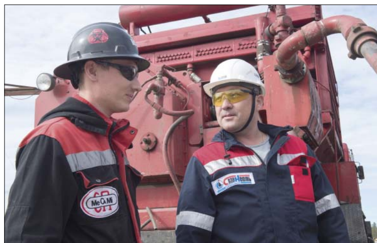
Особое внимание уделяется интеграции партнеров Общества – сервисных подрядных предприятий – в систему управления охраной труда и вовлечение трудовых коллективов в реализацию единых стандартов