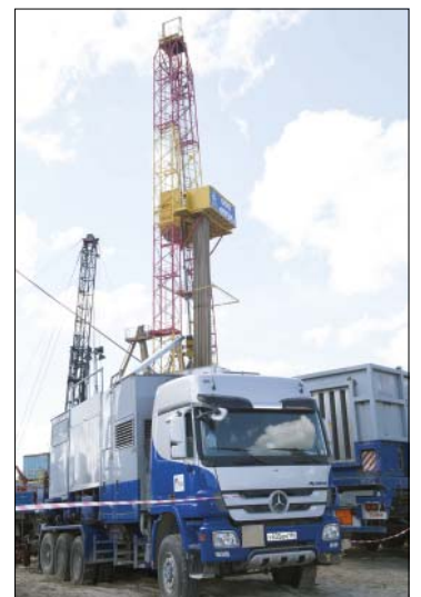
В 2016 году были успешно опробованы и показали свою высокую результативность 10- и 12-стадийный ГРП по стандартной технологии, а также 10-стадийный метод ГРП по технологии HiWAY

Следуя принципу социальной ответственности бизнеса, акци-