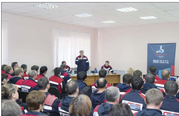
В 2016 году произошла перезагрузка подходов к решению вопросов безопасности. Принцип «Безопасность начинается с меня» стал основополагающим