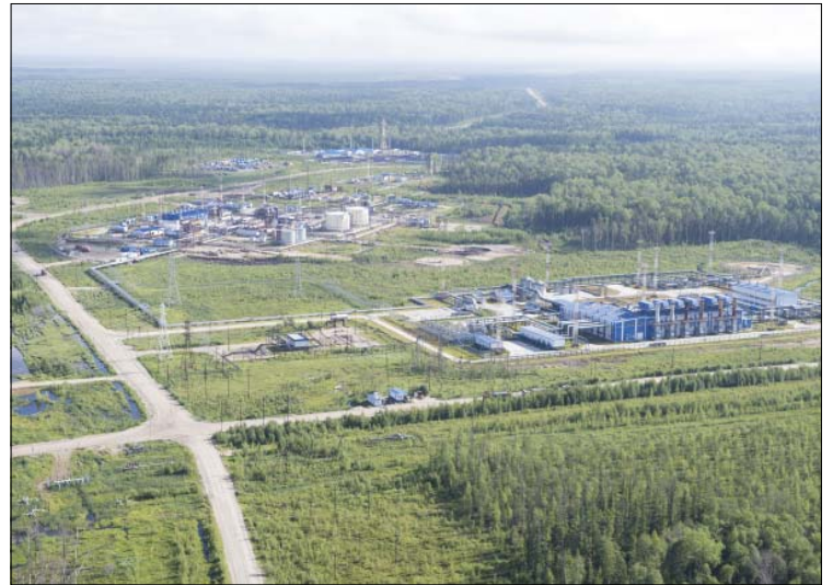
География производственной деятельности «Славнефть-Мегионнефтегаза» включает в себя 26 месторождений, расположенных в Нижневартовском, Сургутском и Нефтеюганском районах Ханты-Мансийского автономного округа – Югры

Безопасность и экологичность – ключевые приоритеты производственной политики. Только безопасное производство может быть эффективным, а значит, стратегической целью является нулевое значение аварий и травматизма. В 2016 году произошла перезагрузка подходов к решению вопросов безопасности. Принцип «Безопасность начинается с меня» стал основополагающим. Прозрачность, четкое понимание существующих проблем и узких мест, личная ответственность за свою безопасность и безопасность своих коллег определены ключевыми факторами в обеспечении безопасности производства. При этом особое внимание уделяется интеграции партнеров Общества – сервисных подрядных предпри-